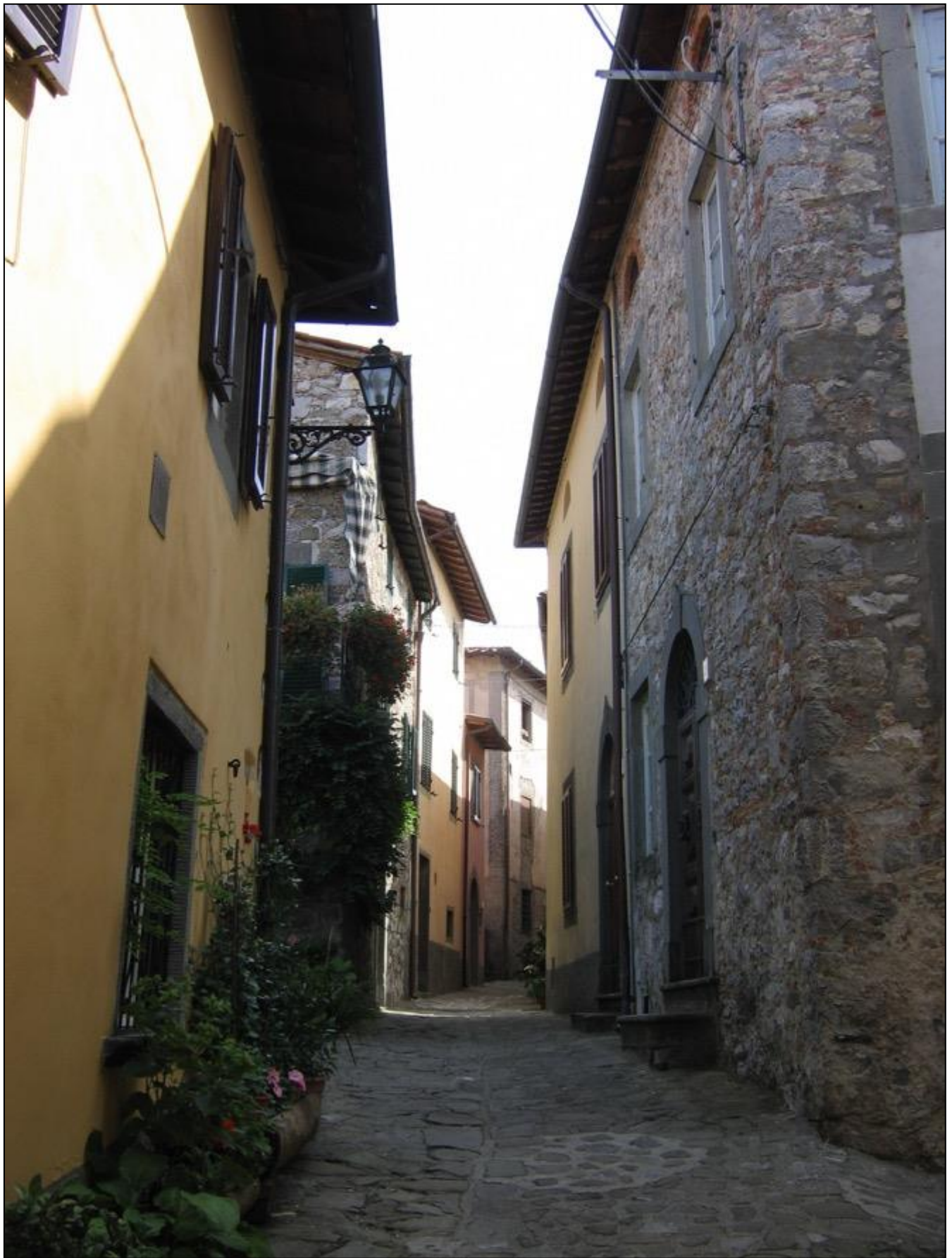
Mentusardo. Una panchina di legno, che ai miei tempi ricordo di pietra e senza