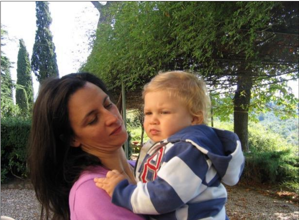
Equinozio di autunno. Il piccolo che ha dormito con noi è andato a